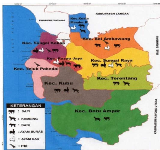
Gambar 2.1 Peta Kawasan Pengembangan Peternakan Kabupaten Kubu Raya