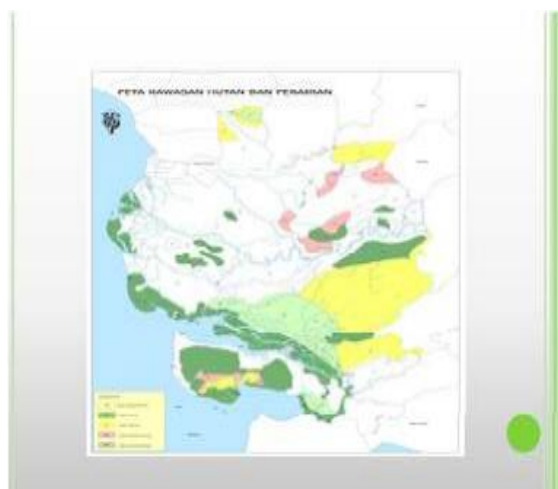
Gambar 2.2 Peta Kawasan Hutan dan Perairan Kabupaten Kubu Raya